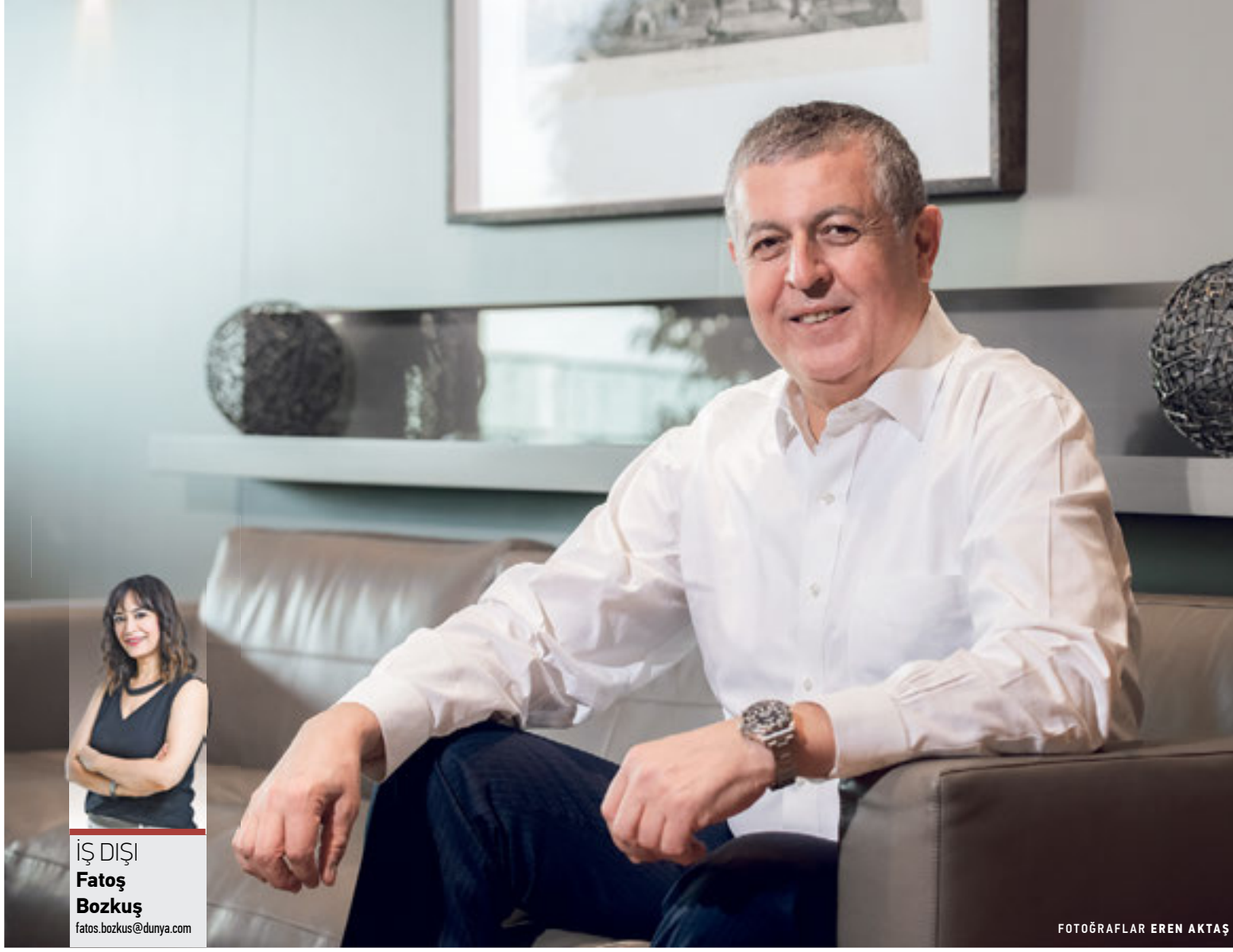
İŞ DIŞI